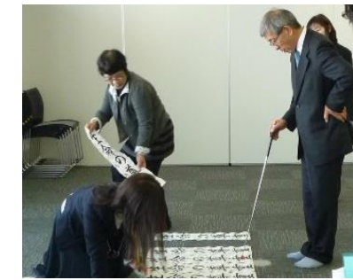
作品を審査して、特賞を選びます。